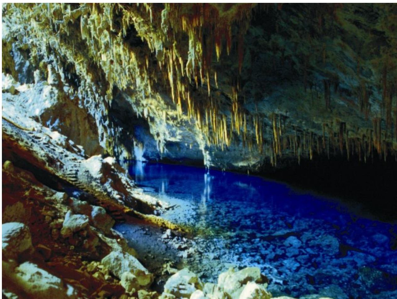
Gruta Lago Azul